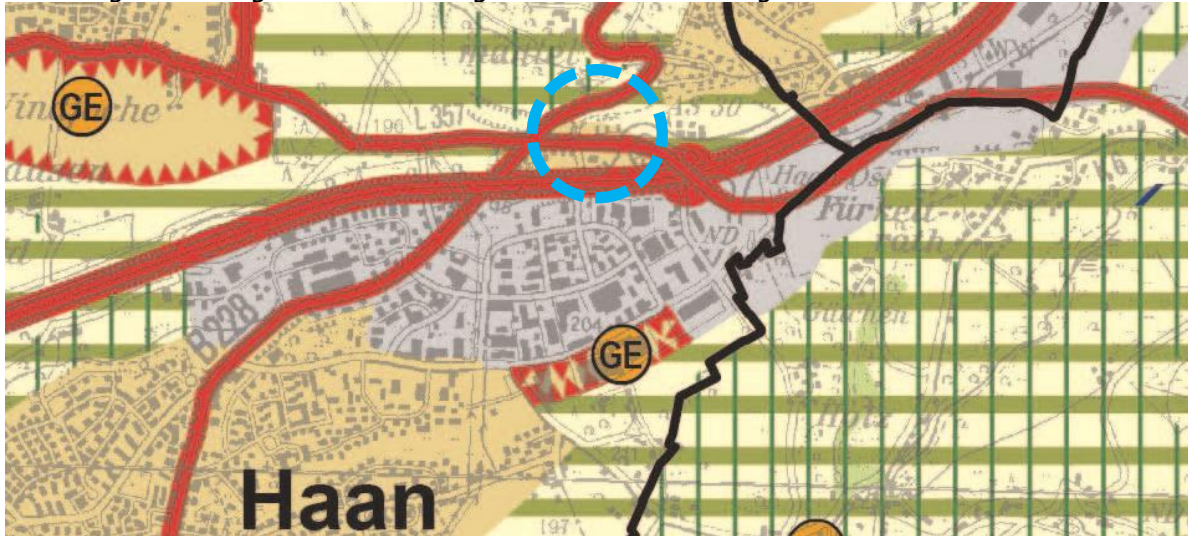
Abb.: Auszug Regionalplan Düsseldorf

Der Regionalplan für den Regierungsbezirk Düsseldorf (RPD) stellt die Fläche des vorliegenden Plangebietes als allgemeinen Siedlungsbereich (ASB) dar. Demnach folgt die beabsichtigte Planung den Zielsetzungen der Raumordnung.